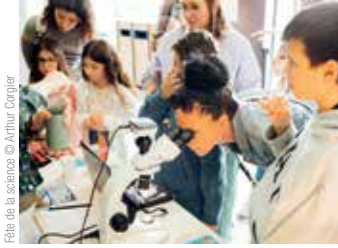
Fête de la science