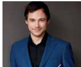
N. Ellis

Le Quai, Angers, du 31 janvier au 7 février 2025. • Le Carré, Château-Gontier, 28 février.