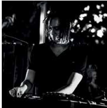
Du Rock et des Vaches - Bamboo Station