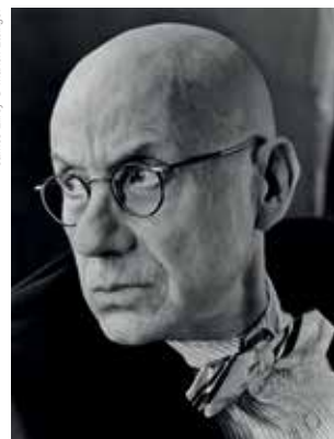
James Ellroy