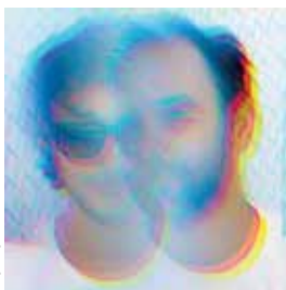
Pony Pony Run Run