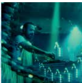
Arnaud Gonzalez © DR