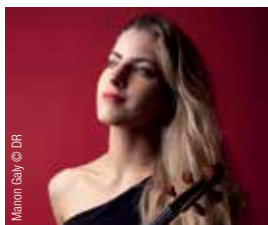
Manon Galy © DR

Centre de Congrès, Angers, 26 novembre. • Le Dôme, Saumur, 28 novembre. • Théâtre Saint-Louis, Cholet, 1 er décembre.