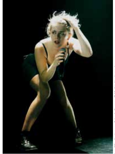
Les Z'Ec d'automne - Zahro de Sagazan