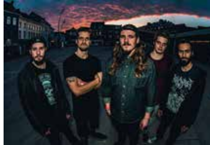
Omega Sound Fest - Brutal Sphincter