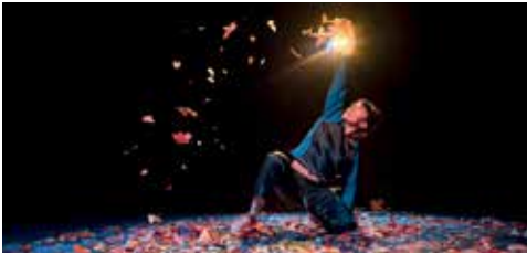
Plein les billes Premiers printemps