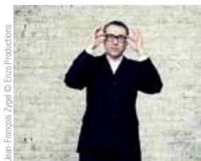
Jean-François Zygel