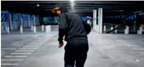
Scarlett et Novak