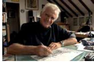
Angers BD - Dany