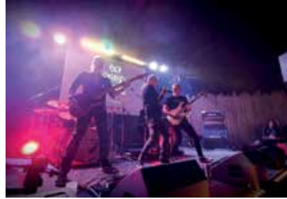
Prostate Music Tour - Made in Japan