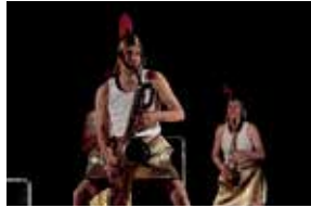
Arts d'hiver - Zik-Zap