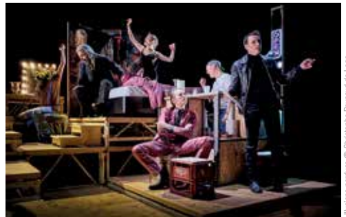
Illusions perdues © Christophe Reynaud de Laga