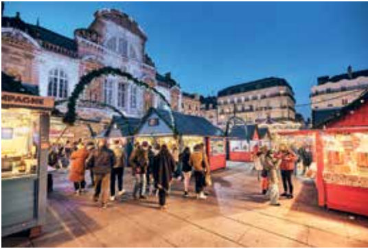
Chalets de Noël, place du Ralllement