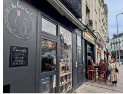
À boire et à manger