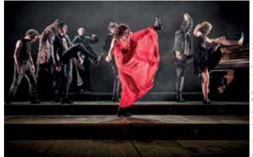
Splendeurs et misères

OCIDENT Mercredi 4, jeudi 5 et vendredi 6 décembre à 20h. Théâtre du Champ de Bataille, Angers.