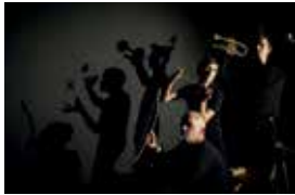
© Cie Ma offre pas non, vous avez suivi !