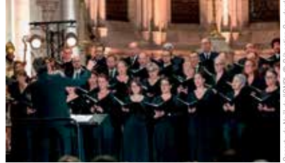
Concert de Noël de l'ONPL